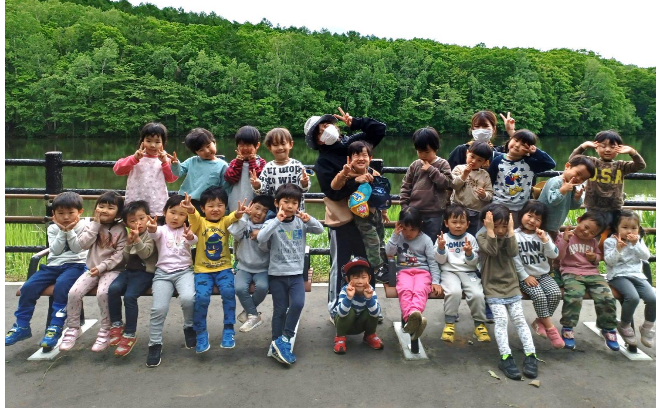
水源池に行ってきました(^^♪