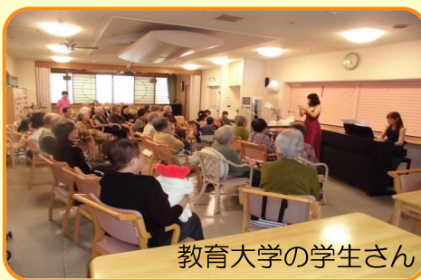
教育大学の学生さん