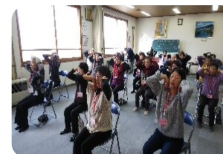
みんなでやると頑張れますね♪