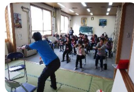
まずは体を伸ばしましょう！