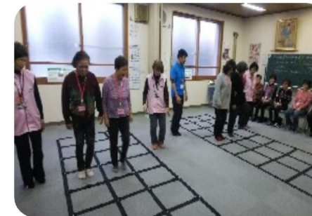
ふまねっともやっていますよ！