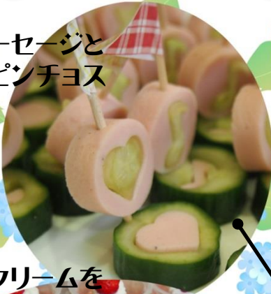
魚肉ソーセージと 胡瓜のピンチョス