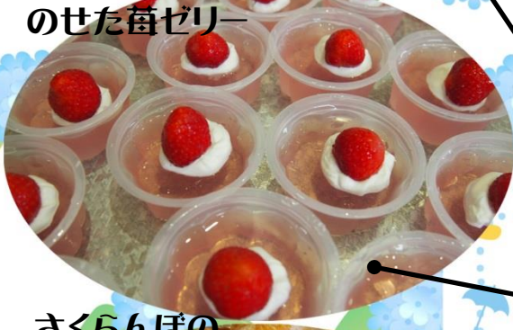
苺と生クリームを のせた苺ゼリー