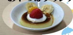
おやつはプリンアラモード