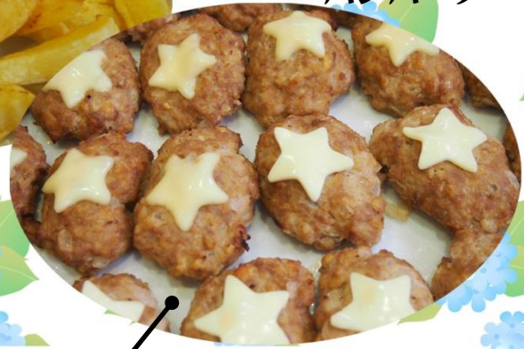
星型チーズと ハンバーグ