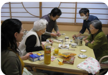
事前の打ち合わせ風景

初回にも関わらず20名ほどのお客様が来て下さり、コーヒーやハーブティー、アイスなど注文されカフェは笑い声が絶えませんでした。毎月1回の取り組みを予定しており、スタッフについても、地域で活動されている様々な方にもお願いし、お客様とスタッフとの交流も大切にしていきたいと考えております。