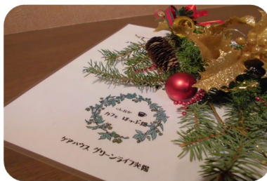
リース作りもしました