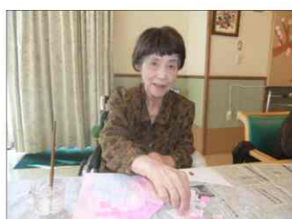
「心と手のリハビリにもなってます♪」