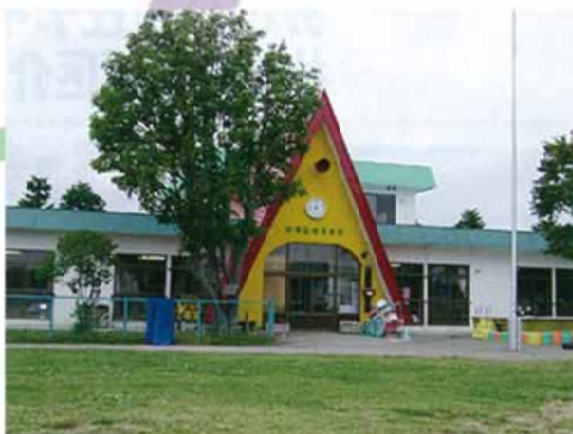
なつかしい三角屋根の保育園・・・