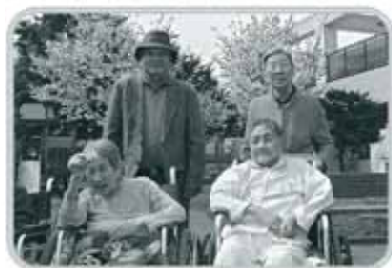
「今年の桜もきれいだね。」

5月12日やっと中庭の桜が満開になり待ちに待ったお花見を行う事ができました。今年は本格的にテーブルを出し、ビールや新茶・コーヒーで乾杯し、大きなケーキや枝豆などのおつまみを用意しました。食べ物や飲み物を前にすると、桜そっちのけで皆さん花より団子になっていましたが・・・皆さん笑顔の一日でした。