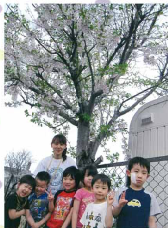
桜の木は、そのままです