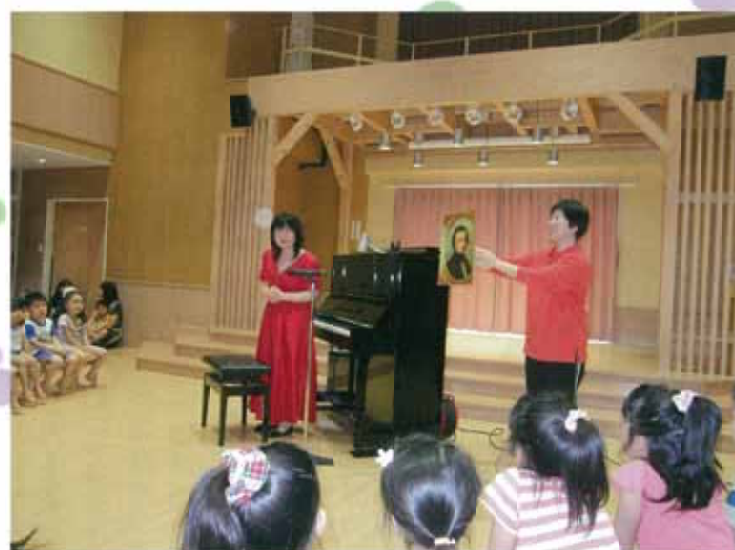
プロのピアニストによるコンサートも開かれました♪