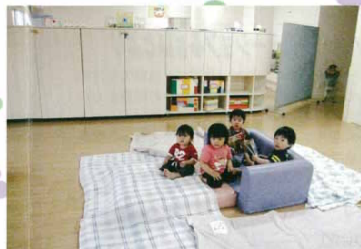
乳児室は、収納式仕切り棚で、二つの部屋に分かれています。移動可能なため、部屋の広さを調節することができます。