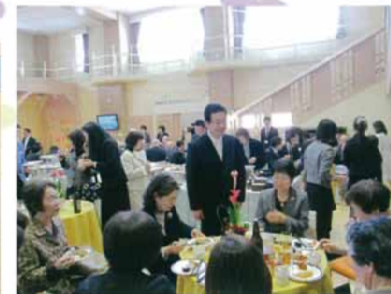
たくさんの皆様にお越しいただき、ありがとうございました！