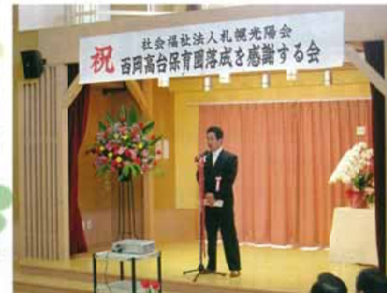
西岡高台保育園落成を感謝する会