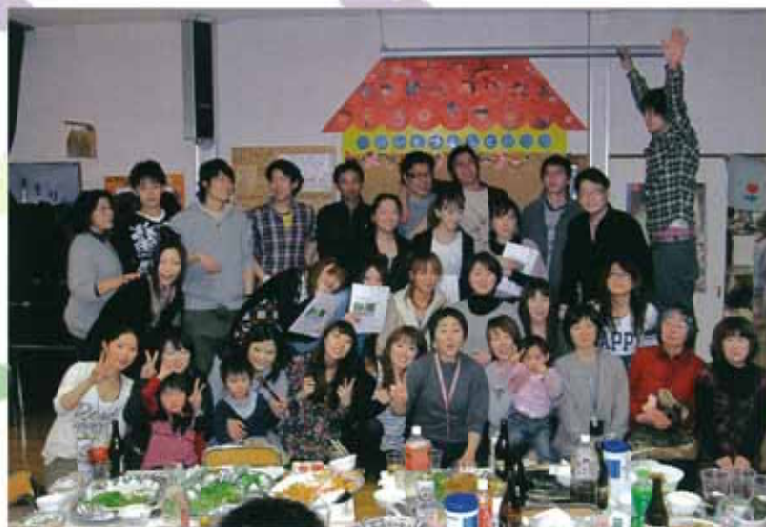
なつかしい顔・顔・顔・・・(^ ^) 同窓会にて