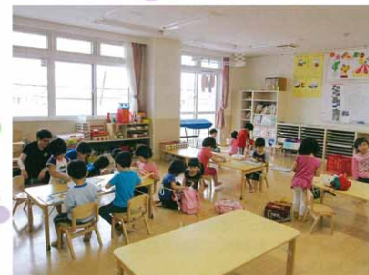
2階には、3、4、5才児のクラスがあります。部屋の外には、避難通路がつながっています。