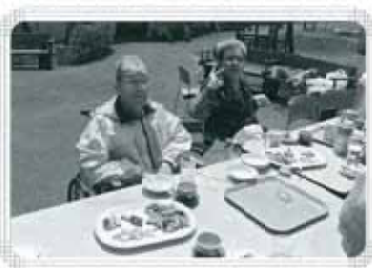
「外で飲むビールは格別!!!」